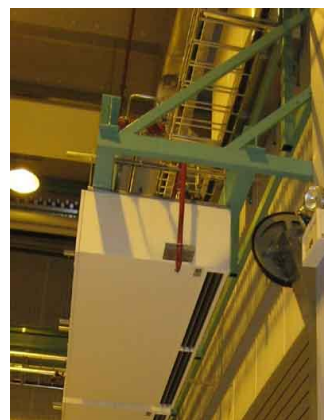
Exempel på konsoler vid vikportar